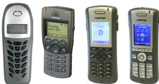
DT190, DT 292, DT 4x2, DT590, DT390 et DT690

Le DT390 est un téléphone simple de conception moderne. Il est idéal pour les environnements purement professionnels.